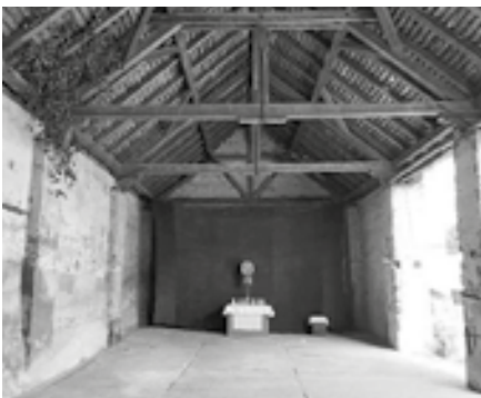
De voormalige graanschuur waarin een altaar werd opgesteld

In de zomer van 2024 bouwden Spaanse en Hongaarse jongeren samen aan een voormalige boerderij,