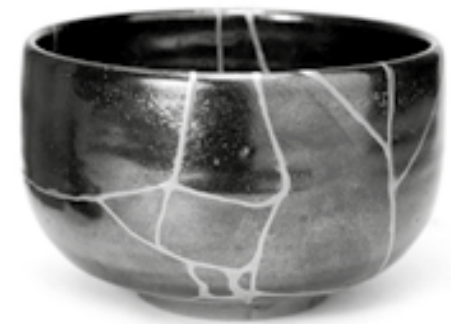
Kintsugi, Japanse reparatiekunst van keramiek

Wanneer je gaat repareren, dan maak je iets wat stuk was weer heel, weer bruikbaar. Soms kun je het zo repareren dat er van de reparatie vrijwel niets meer te zien is. En soms is de reparatie duidelijk zichtbaar, als een teken dat daar wat gebeurd is, er is aan gewerkt. Kintsugi (wat vertaald kan worden als 'gouden verbinding') is de Japanse kunst van het repareren van gebroken kera-