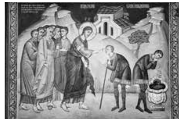
De genezing van de blindgeborene, Russische icoon

Aan de gemeente schreef ik in die tijd: 'Ik voel dat ik anders word en merk dat ik met andere ogen mag leren kijken en ook met andere oren leer luis-teren. Alles wordt nieuw. In het beeld van een uitkomende vliinder ben ik in het stadium beland van een vliindertje dat los van de pop op een tak voor het eerst de voelsprietten uitstrekt om op nieuwe wijze de wereld te leren kennen en op te zuigen.'