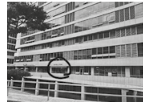
Gemeenteruimte (omcirkeld) van de initiatiefgroep voor de Christengemeenschap in Korea

Nadat twee jaar geleden de mensenwijdingsdienst voor het eerst in het Koreaans kon worden gehouden, volgde in juli van het afgelopen jaar de volgende stap: De Koreanen konden voor het eerst de kinderdienst ervaren. In januari 2025 volgde een bijeenkomst rondom de jeugdwijding, doop en biecht. In Korea kan tweemaal per jaar de dienst gehouden worden. In de tussentijd komt de gemeente bij elkaar zonder priester. Inmiddels wordt er ook godsdienstonderwijs gegeven door mensen uit de gemeente.