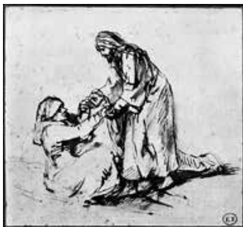
De genezing van de schoonmoeder van Petrus, Rembrandt van Rijn (1658) penseeltekening Fondation Custodia, Parijs

Het is voor mij de kunst om te ontdekken hoe ik iemand werkelijk kan ontmoeten. Ik had een patiënte die last had van wanen – ze zat gevangen in nare gedachten die ze als realiteit beleefde. De eerste keer dat ik haar bezocht, zei ik toevallig iets over een afbeelding van het kruis, die op haar tafel lag. Dat leidde ertoe dat ze wilde overstappen naar 'die dokter, die iets heeft met religieus zijn'. Als ik dan weer eens bij haar kwam, zag ik dat ze weer zo ongelukkig vast zat in haar gedachten. Praten over een religieus thema bracht haar dan vrijwel meteen weer bij zichzelf. Ik kon het zien gebeuren. Ze stapte vanuit haar wanen over naar de werkelijkheid. Zo mooi, daar zie ik de oprichtingskracht, die Christus brengt.