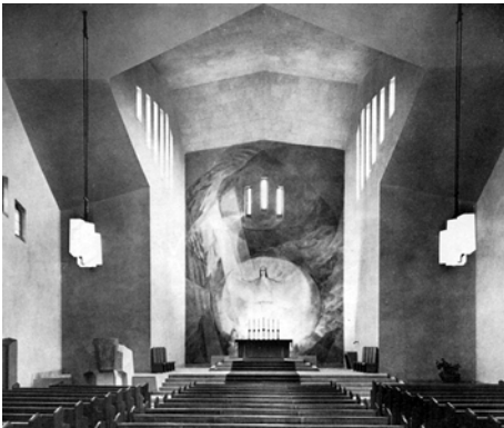
De kerkruimte van de gemeente Berlijn West

In dit sobere kerkwijdingsritueel van de Christengemeenschap is van exorcisme geen sprake, eerder van een krachtig ja zeggen tegen Christus' aanwezigheid in de aardse natuur sinds hij uit de dood is verzeen. Tweemaal wordt er een groot kruis in de ruimte geschreven, dat samenvalt met de vier hoofdrichtingen op aarde. Daarbij worden de vier elementen aangesproken als wezens die ons mensen kunnen helpen, om op aarde steviger vorm aan te nemen en om meer bezielde en van de geest doordrongen te werken. Dit doet denken aan woorden uit de grondsteen tekst van de Antroposofische Vereniging die uitdrukken dat 'de geesten in oost, west, noord, zuid' de waarheid over het mensenwezen al horen, voordat wij mensen die zelf vernemen.