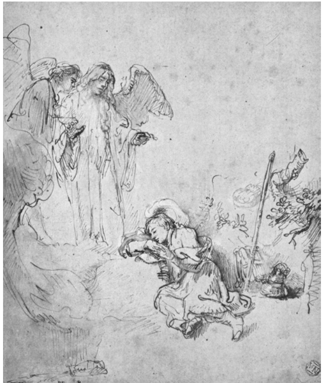
'Jacobs droom te Bethel', Rembrandt 1655, Rijksprentenkabinet Amsterdam

Zodra de bouw of verbouwing van een kerk