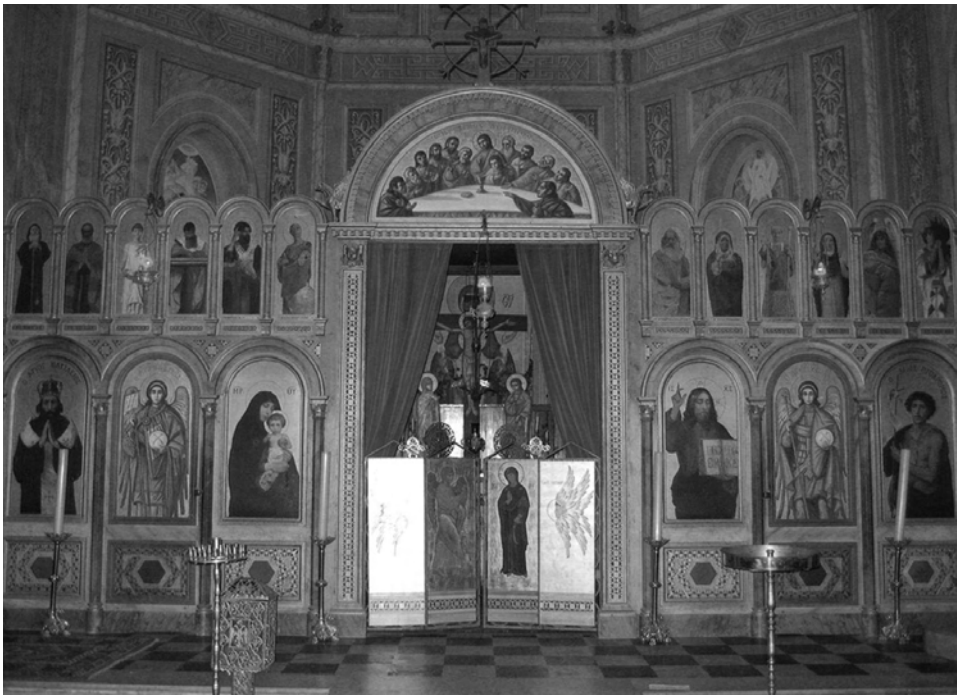
Iconostase van de Servisch Ortodoxe kerk in Brazilië

het voltrekken van de mensenwijdingsdienst, alles wat met de dienst te maken heeft weer in verbinding gebracht wordt met een wijdingsstroom, ook de al gewijde gewaden en voorwerpen zoals het altaar, de kelk, de beeltenis, de kandelaars, het wierookvat. Het eenmaal gewijde wordt door het 'gebruik' als het ware opnieuw gewijd, ook de mensen en de ruimte. Of omgekeerd: gewijde voorwerpen, gewaden (en mensen!) verliezen langzaam maar zeker weer de kracht van de wijding als ze niet meer voor de cultus gebruikt worden. Dit wordt begrijpelijk wanneer we bedenken, dat met het wijden bepaalde krachten, concreter: bepaalde wezens samenhangen. Ook dit kennen we wel uit een meer dagelijkse sfeer: een muziekinstrument, dat langere tijd niet bespeeld is, moet eerst weer worden ingespeeld voordat het opnieuw gaat klinken als voorheen.