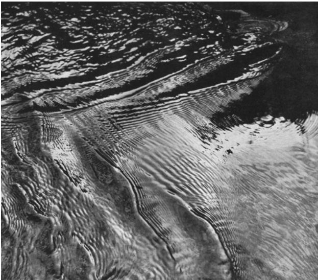
'Water in een rijk golvenspel', uit: Theodor Schwenk (1988), Das sensible Chaos, Freies Geistesleben

Dan kan in deze heilige ruimte het lichaam aangeraakt worden. Op dat moment mag het wezen van het kind ervaren: 'Ook in de aardstof leeft de goddelijke wereld die ik voor de geboorte kende. Dit geeft mij het vertrouwen om de weg van de hemel naar de aarde te gaan, steeds meer aardemens te worden, want tot in de stoffelijkheid, die ik tot mijn lichaam maak, is God werkzaam'. Het kind wordt aangeraakt met de goddelijke Drie-eenheid, zoals die zich in het aardse openbaart.