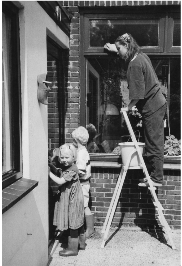
'Levensstromen in goede banen leiden'

Het schoolkind emancipeert zich rond de tandenwisseling van deze omhullende levenskrachten en wordt daarin zelfstandig. De kracht komt vrij voor leerprocessen en het kan gaan leren om de wereld te begrijpen en om in de wereld te werken. Het kan leren om zelf te bidden door dat met de volwassenen samen te doen. Het avondgebed voor het slapen gaan, dat voor het kleine kind nog door de ouder werd gezegd, kan steeds meer samen worden gezegd (of gezongen), tot het kind het op zeker moment helemaal zelf doet. Rondom de maaltijd creëer je met elkaar een moment in een stemming van dankbaarheid aan die krachten in de wereld die aan de totstandkoming van de maaltijd hebben bijge-